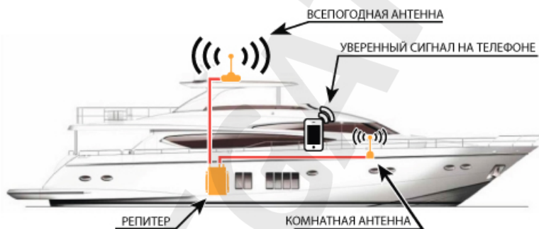
Схема №2. Пример установки системы усиления сотового сигнала на яхте.