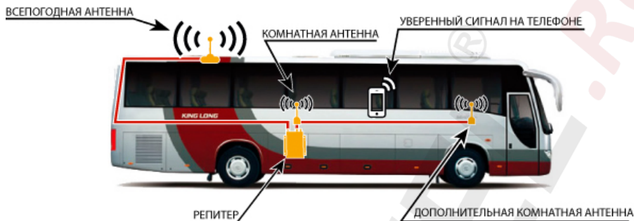
Схема №1. Пример установки репитера в автобусе.

Репитер представляет собой высокочувствительный двунаправленный СВЧ-усилитель сотового сигнала, поэтому при его установке нужно, чтобы всепогодная и комнатные антенны были хорошо изолированы друг от друга и не возникло самовозбуждения репитера. Чтобы наглядном примере понять, что такое самовозбуждение, возьмите, к примеру, микрофон и громкоговоритель и поднесите их близко друг к другу – вы услышите очень сильный шум. Репитер будет работать бесперебойно только в том случае, если электромагнитная развязка будет достаточной для устойчивой работы системы усиления сотового сигнала.